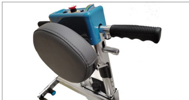
Reposacabezas ajustable en altura.