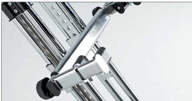
Pestaña curvada que proporciona un agarre más firme de la silla de ruedas a la oruga.