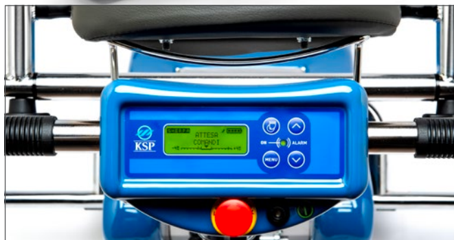
Panel de control digital que permite introducir al cuidador diversos parámetros (velocidad, modo de subir las escaleras -individualmente/ciclo continuado...) garantizando un uso seguro y simple del sube escaleras. Solo disponible en la Sherpa N988.