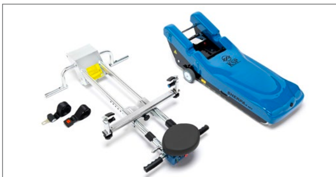
Transportable en secciones.