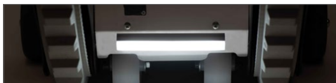
Luces delanteras y traseras.