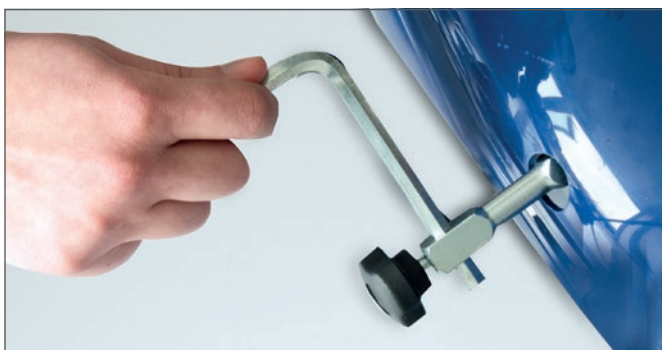
Dispositivo manual en caso de quedarse sin batería.